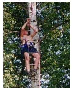
Anklicken zum Vergrößern