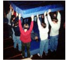
Anklicken zum Vergrößern